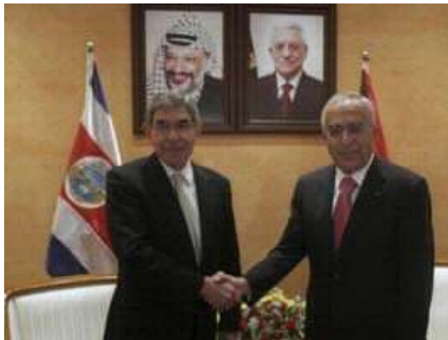
Arias y Fayad

Precisamente a Fayad, el presidente Arias le planteó seguir el ejemplo costarricense de la abolición del ejército. Según los medios de prensa, el presidente expresó "no importa la cantidad de armas que tengan, nunca van a poder triunfar frente al Estado de Israel (...) ¿Para qué necesita Palestina un Ejército?, ¿de qué tamaño tiene que ser ese Ejército para impedir un ataque de Israel? ¿Por qué no declararle la paz al mundo, como hicimos nosotros en 1948? ¿Por qué no hacer de la indefensión su mejor defensa?" Difícilmente se podrían haber esperado unas afirmaciones tan desafortunadas, insensibles e inoportunas, dadas las circunstancias de la ocupación que sufren los palestinos a manos de uno de los ejércitos más poderosos del mundo. La sugerencia de Arias constituía prácticamente un llamado a la capitulación frente a la ocupación y así lo han de haber tomado las autoridades palestinas. Mientras Abbas recorría América Latina recibiendo muestras de solidaridad y apoyo a la constitución de un Estado palestino, Arias sugería a los palestinos, -en su propia tierra- que aceptaran su fortuna y dejaran de resistir al ocupante. Una sugerencia que obviamente fue celebrada por el Embajador israelí Ehud Eitam, cuyo gobierno exige que el futuro Estado palestino sea una entidad desmilitarizada.