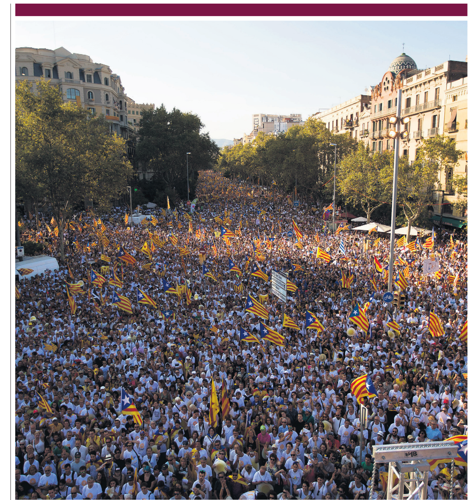
Miles de personas se manifestaron este domingo con banderas para pedir la independencia de Cataluña, en Barcelona, España.

--- Creo que los jóvenes quieren utilizar algunos medios que rompan el falso equilibrio, algo que precipite los acontecimientos. Abdelaziz decía que, si no se llegaba a un acuerdo político, se estaba obligando a la población saharauí a recurrir a la violencia, que es un derecho reconocido para los pueblos coloniales. Naciones Unidas reconoce el derecho de los pueblos a la violencia para conquistar su independencia. ■